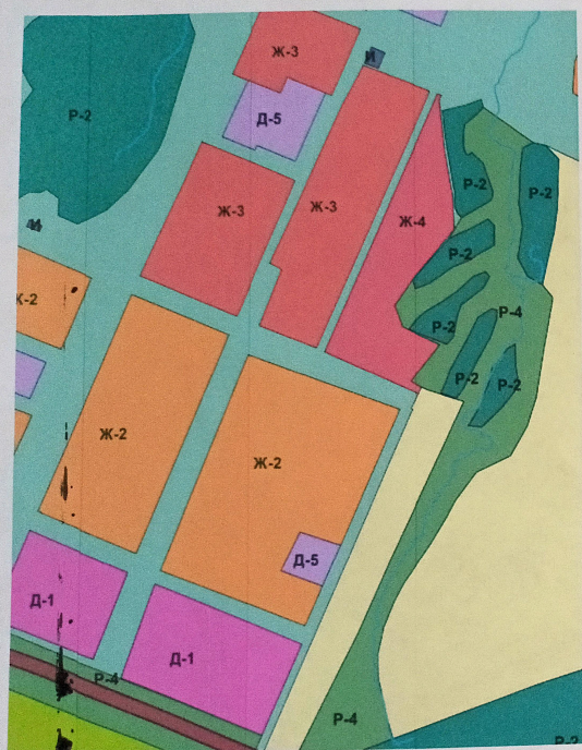
Схема из проекта внесения изменений в Правила землепользования и застройки городского округа "Город Воткинск" Удмуртской Республики